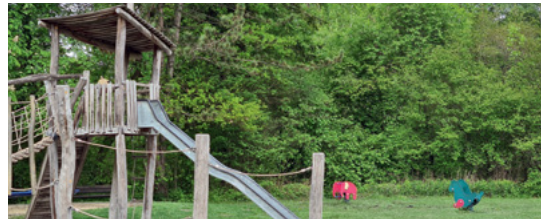
Spielplatz Roggensteiner Allee