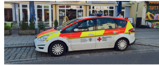
HVO (Helfer vor Ort)