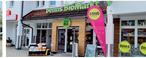
Neuer Biomarkt in Eichenau

Die Umsetzung des Mottos „EICHENAU(ER)LEBEN“ liegt mir auch in den kommenden sechs Jahren von 2022 bis 2028 sehr am Herzen und hier werde ich für Sie und die Marke „Eichenau“ noch vieles erreichen, wenn Sie mir die Möglichkeit dazu geben. Deshalb möchte ich Ihnen einen kleinen Ausblick geben: