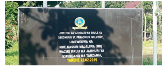
1.000 Schulen für unsere Welt