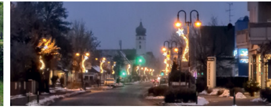
Weihnachtsstimmung in Eichenau