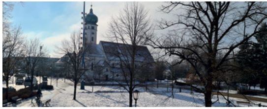
Ortsmitte Eichenau im Winter