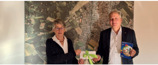
50 Jahre VHS Eichenau